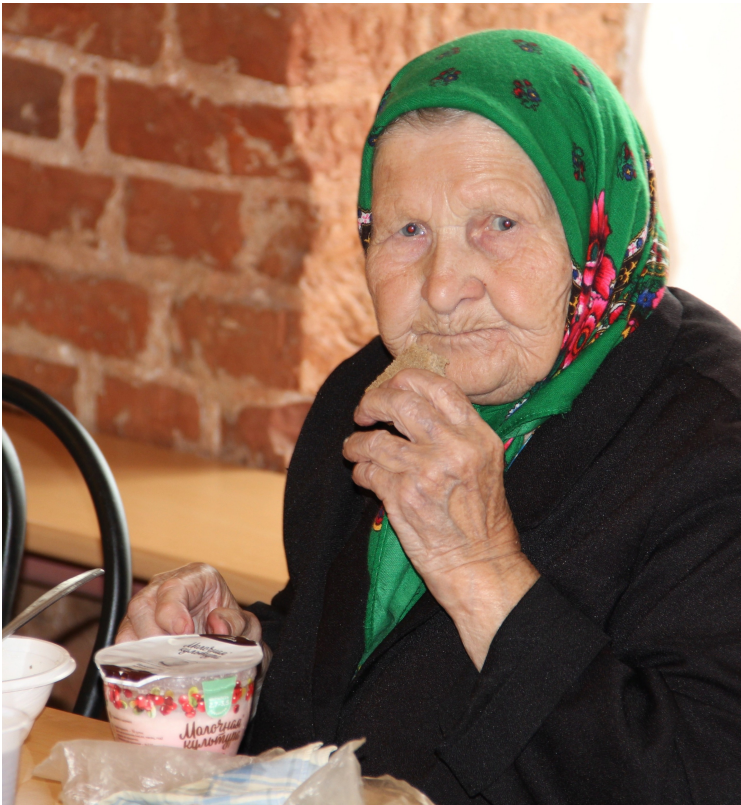
Обед в Благотворительной столовой